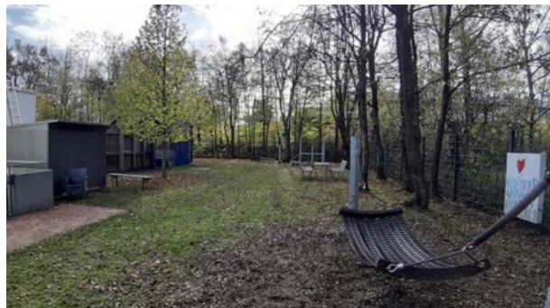
Abbildung 14: Außenbereich im Südwesten des Grundstücks