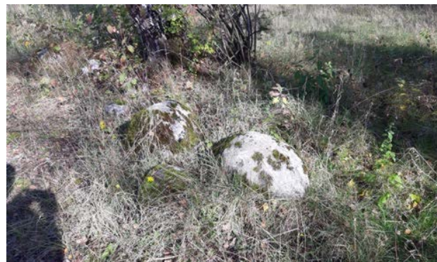
Abbildung 10: Besonnte Steine innerhalb der Grünfläche zw. Mehlbeer- und Eschenstraße