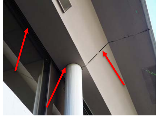
Abbildung 31: Detailaufnahme der Fassade mit mehreren Spalten, die als Fledermausquartier geeignet sind.