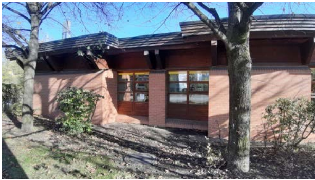
Abbildung 17: Südfassade des Postgebäudes