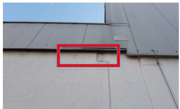
Abbildung 29: Detailaufnahme eines Spaltes an einer Fassade als potenzielles Fledermausquartier