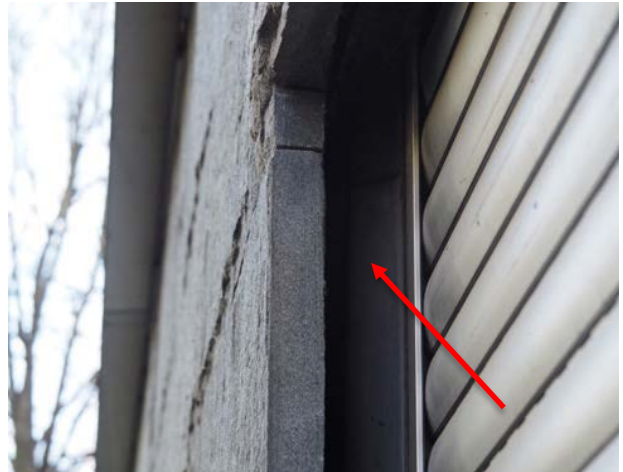
Abbildung 37: Breiter Hohlraum hinter einer Wandverschalung aus Stein in der Lindenpassage