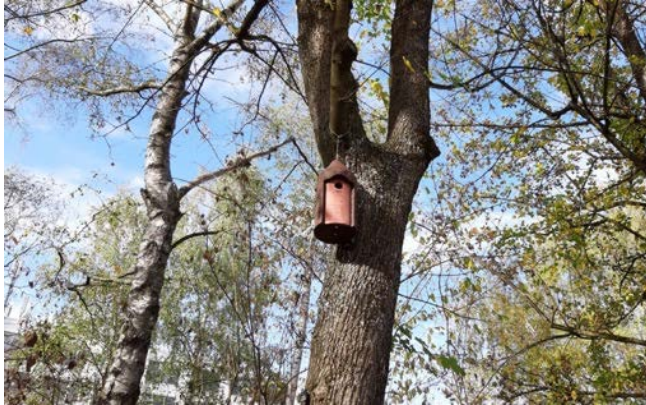
Abbildung 24: Vogelnistkasten im Westen des Grundstücks des Jugendkulturzentrums