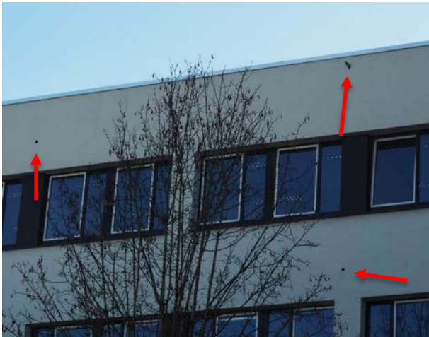
Abbildung 32: Blick auf die Nordfassade des Gebäudes in der Mehlbeerstraße 2 mit drei von mind. 22 Höhleneingängen, die der Buntspecht in die Fassade geschlagen hat