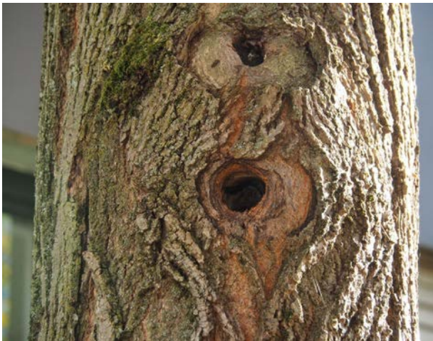
Abbildung 40: Eingang der Spechthöhle an einem Baum innerhalb des Grundstücks in der Mehlbeerenstr. 6