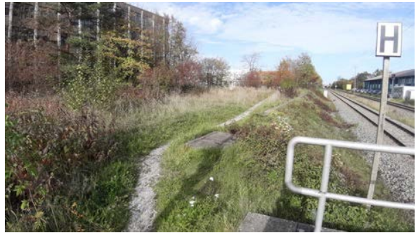
Abbildung 12: Grünstreifen mit östlich angrenzenden Bahngleisen