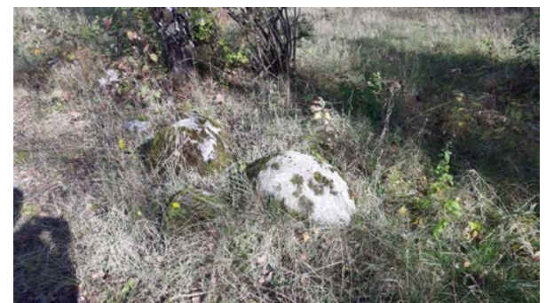
Abbildung 47: Detailaufnahme in der Grünfläche von Abb. 46 mit Steinen als potenzielle Struktur zur Thermoregulation von Zauneidechsen