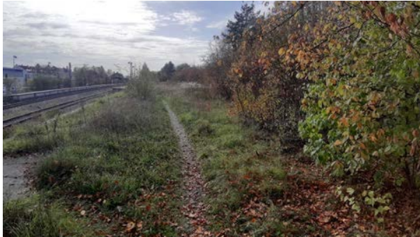
Abbildung 42: Grünstreifen entlang der Bahn im Osten des Untersuchungsgebietes mit Blickrichtung gen Süden

können aufgrund der fehlenden Habitatausstattung ausgeschlossen werden. Für die Zauneidechse sind Teilflächen des Untersuchungsgebietes als potenzielle Lebensräume zu bewerten (siehe Abb. 48). Dazu zählen insbesondere unbebaute Flächen entlang der Bahn (Grünstreifen und unbebaute Teilflächen der angrenzenden Gewerbegebiete) sowie die parkähnliche Grünfläche zwischen Mehlbeerstraße und Eschenstraße.