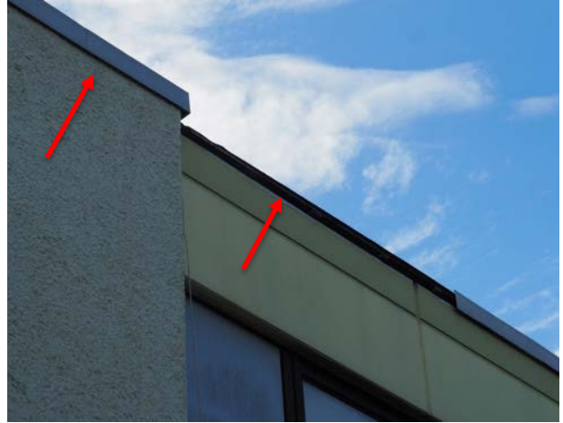
Abbildung 35: Spalt im Bereich des Flachdachabschlusses an einem Gebäude im Nordosten der Eschenpassage