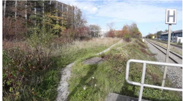
Abbildung 43: Grünstreifen entlang der Bahn im Osten des Untersuchungsgebietes mit Blickrichtung gen Norden