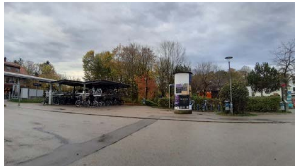
Abbildung 19: Fahrradstellplätze und Gehölzgruppe im Süden des Platzes