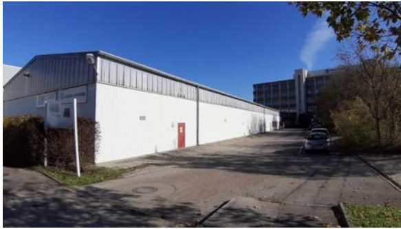
Abbildung 5: Lagerhalle im Westen des Grundstücks in der Mehlbeerstraße 6