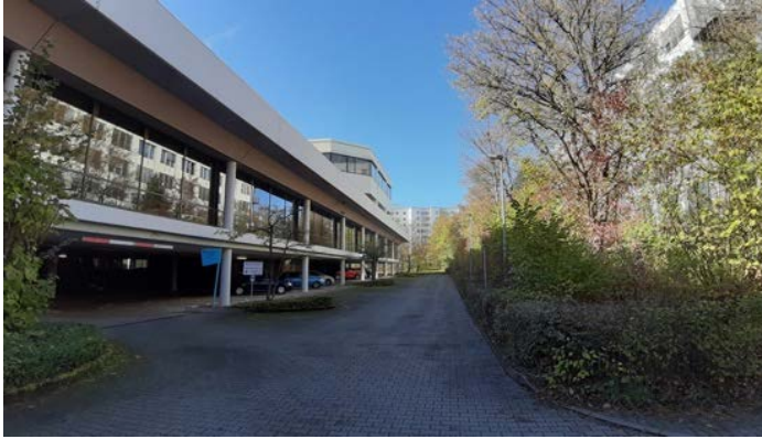
Abbildung 30: Blick auf die Nordfassade des Gebäudes in der Eschenstraße 5