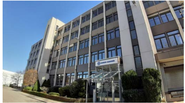
Abbildung 6: Bürogebäude in der Mehlbeerstr. 6