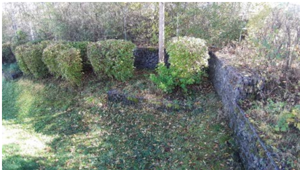
Abbildung 44: Grünfläche mit Gabionen und Strüchern am östlichen Rand des Grundstücks am Lindenring 1 unmittelbar angrenzend an die Bahngleise als potenzieller Zauneidechsenlebensraum