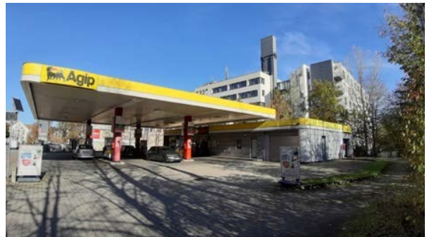
Abbildung 8: Tankstelle am Lindenring 5, im Hintergrund erkennt man das Gebäude der Mehlbeerstraße 2 + 4