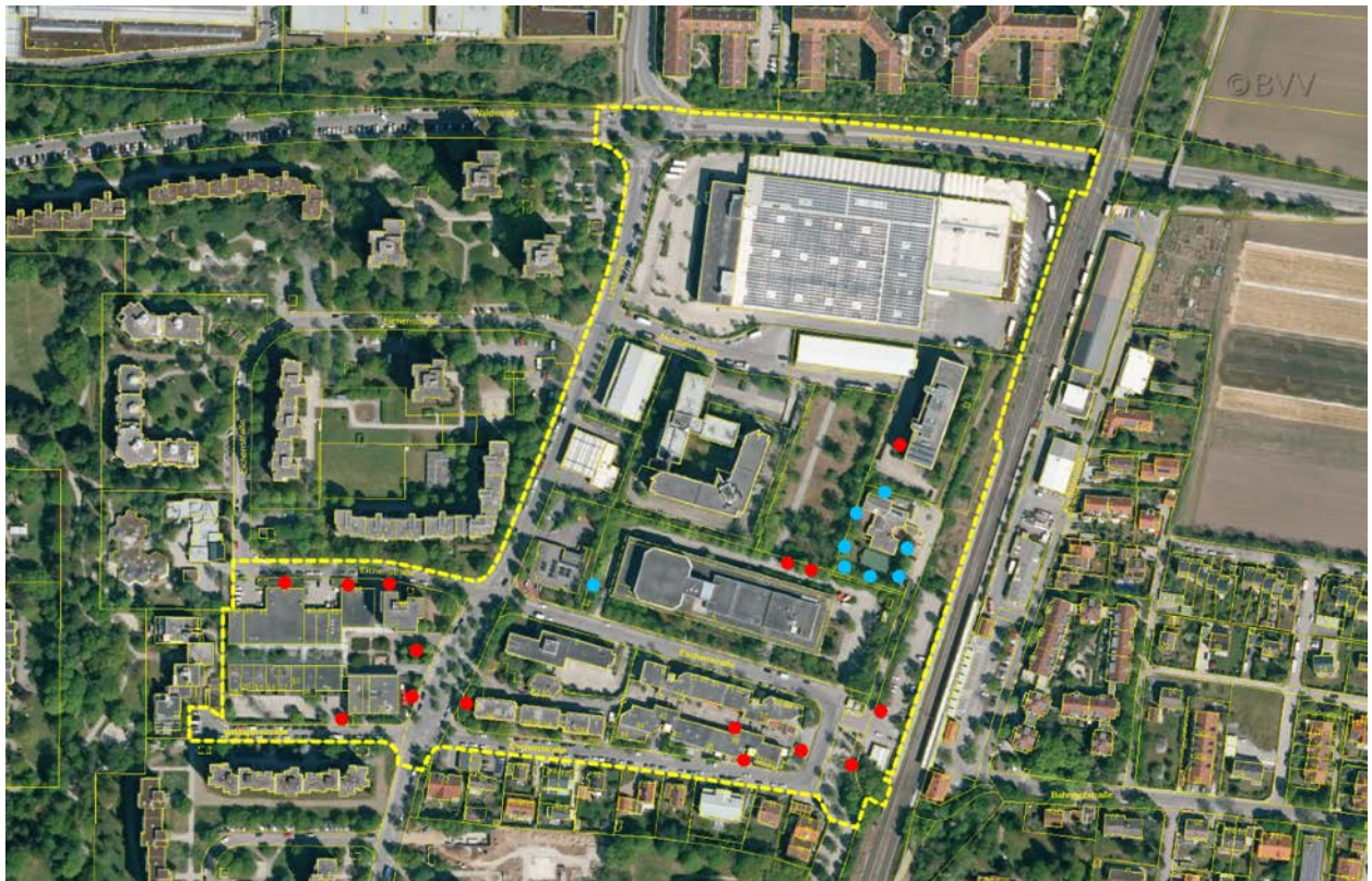
Abbildung 26: Kartierte Höhlenbäume (rote Punkte) und Vogelnistkästen (blaue Punkte) im Untersuchungsgebiet (gelb umrandet)