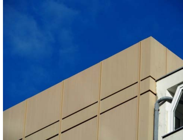
Abbildung 39: Blick auf den Flachdachabschluss des hohen Wohngebäudes in der Lindenpassage ohne Quartierpotenzial