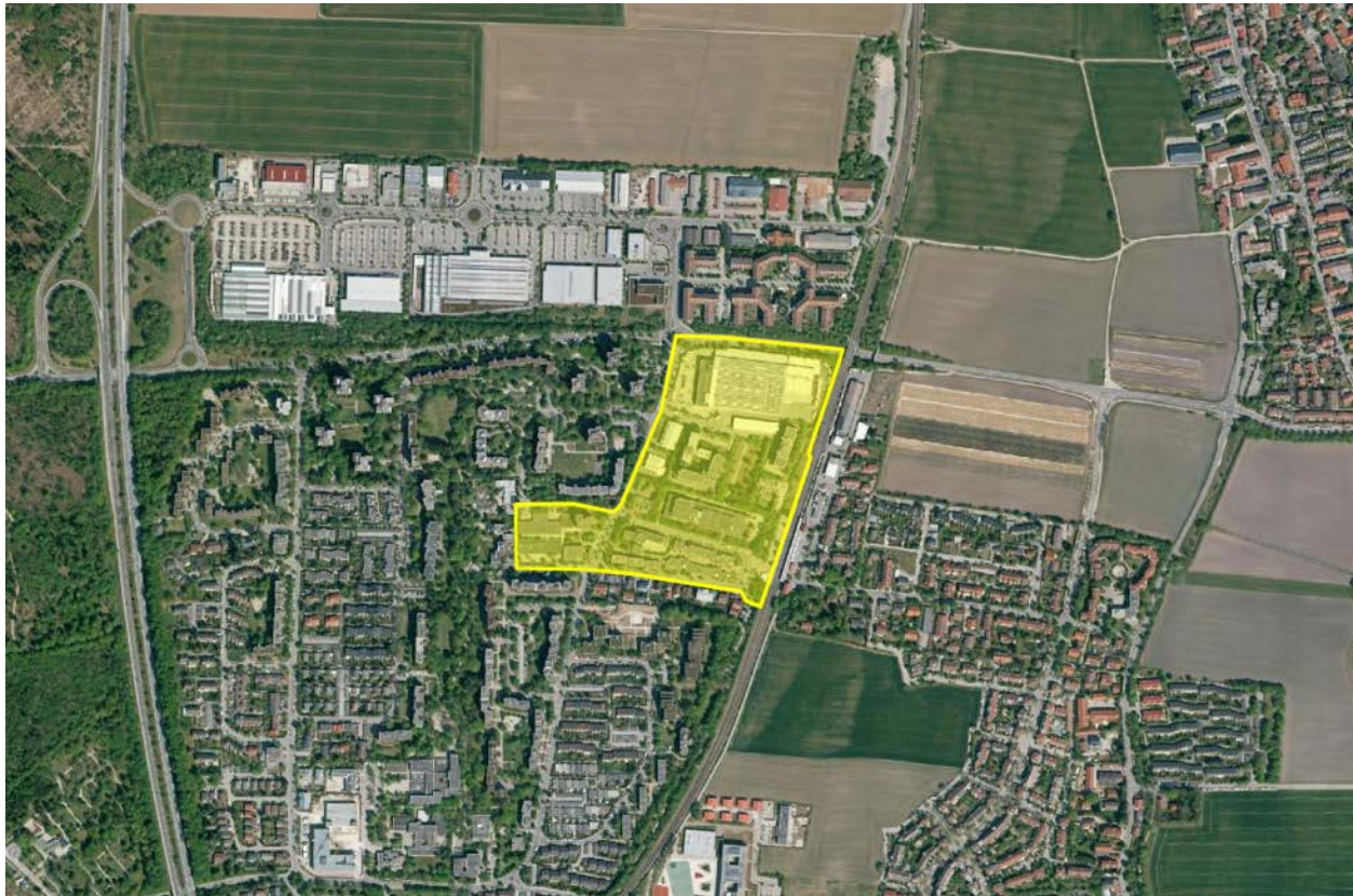
Abbildung 1: Übersichtslageplan mit Untersuchungsgebiet (gelb), Quelle Luftbild: BayernAtlas