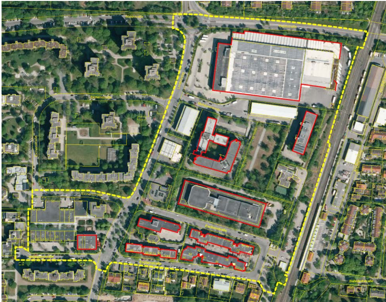
Abbildung 49: Gebäudefassaden mit potenziellen Brutplätzen des Mauerseglers (rot markiert) innerhalb des Untersuchungsgebietes (gelb umrandet), Quelle Luftbild: BayernAtlas

Schwabennester wurden nicht vorgefunden. Das Brutvorkommen von Mehl- und Rauchschnalbe kann sicher ausgeschlossen werden.