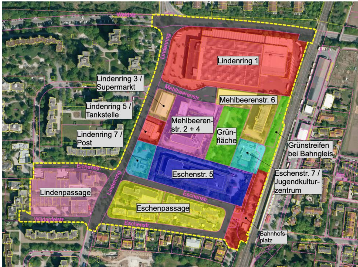
Abbildung 2: Übersichtsplan mit Grundstücksbeschreibungen innerhalb des Untersuchungsgebietes