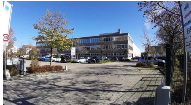
Abbildung 4: Einfahrtsbereich zum Grundstück Lindening 1