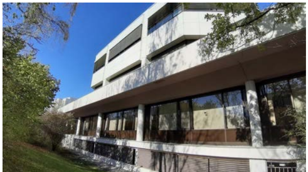
Abbildung 16: Südfassade des Gebäudes