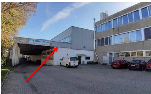
Abbildung 28: Blick auf die Fassade mit dem Spalt von Abbildung 10 im Norden des Untersuchungsgebietes (Lindenring 1)