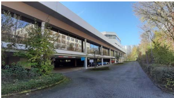
Abbildung 15: Nordfassade des Gebäudes mit Tiefgarage