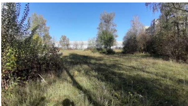
Abbildung 46: Grünfläche im Zentrum des Untersuchungsgebietes etwa 70 Meter westlich der Bahngleise als potenzieller Zauneidechsenlebensraum