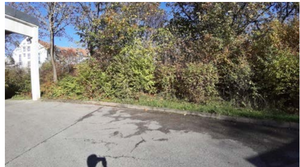
Abbildung 45: Hecke am nordöstlichen Rand des Grundstücks am Lindenring 1 unmittelbar angrenzend an die Bahngleise als potenzieller Zauneidechsenlebensraum