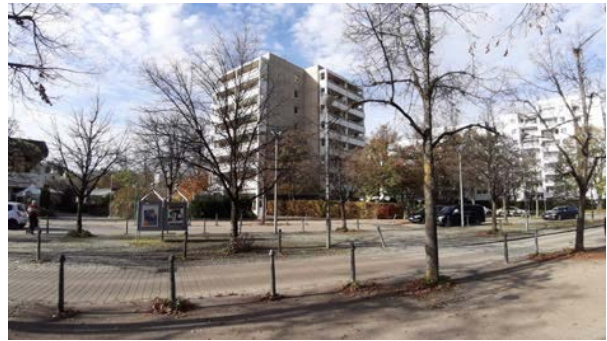
Abbildung 23: Lindenring zwischen Eschen- und Lindenpassage mit Hochhaus im Nordosten der Lindenpassage