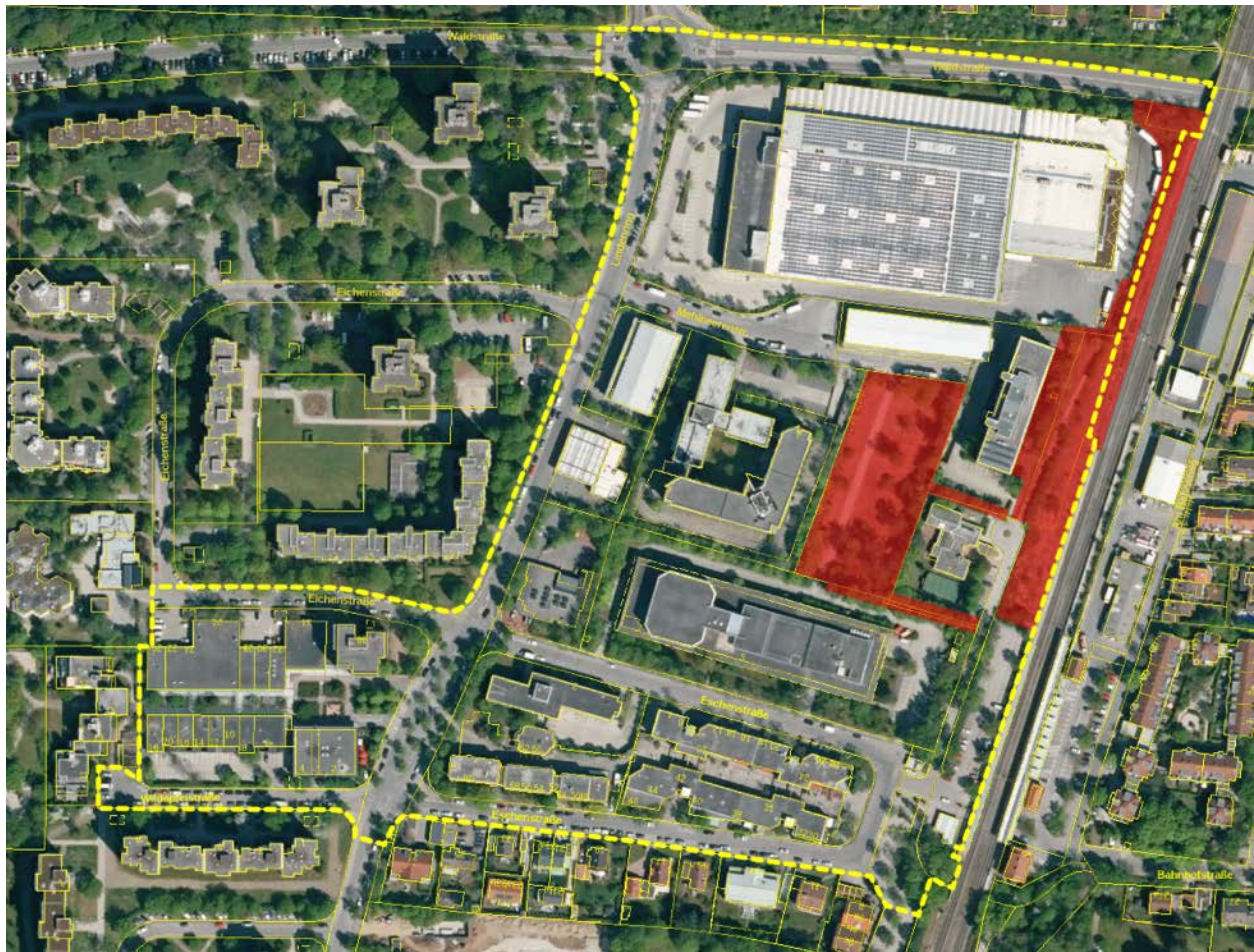
Abbildung 48: Flächen mit potenzieller Eignung als Lebensraum für die Zauneidechse (rot) innerhalb und knapp außerhalb des Untersuchungsgebietes (gelb umrandet)

Fazit: Das Vorkommen der Zauneidechse kann nicht ausgeschlossen werden. Durch das Vorhaben können durch Eingriffe in bzw. Verlust von Fortpflanzungs- und Ruhestätten insbesondere das Tötungs- und Verletzungsverbot sowie das Schädigungsverbot eintreten.