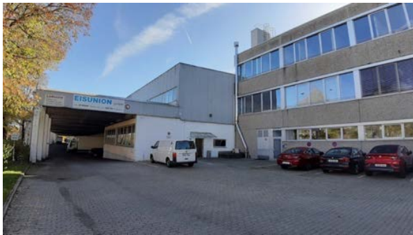
Abbildung 3: Blick auf das Gebäude mit nördlichem Anbau im Nordwesten des Grundstücks am Lindening 1