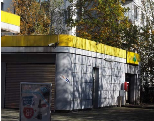
Abbildung 38: Blick auf die Südfassade der Tankstelle am Lindenring 5 ohne Quartierpotenzial