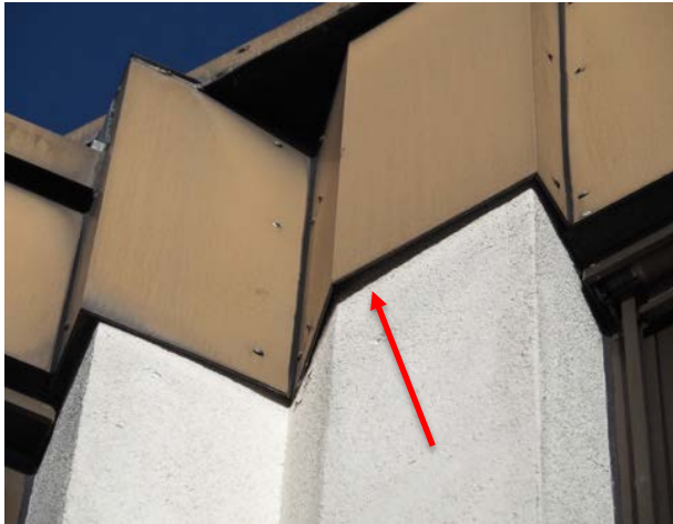
Abbildung 36: Spalt im Bereich des Flachdachabschlusses an einem Gebäude im Südwesten der Eschenpassage