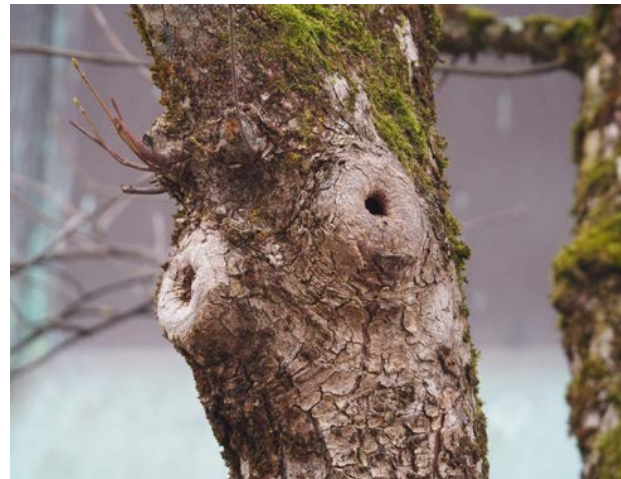
Abbildung 41: Eine von mehreren Stammhöhlen im Untersuchungsgebiet

Fazit: Ein Vorkommen von Tieren im Untersuchungsbereich ist möglich. Durch das Vorhaben ist u.a. ein Verlust von potenziellen Fortpflanzungs- und Ruhestätten verbunden. Dadurch kann das Schädigungsverbot ausgelöst werden. Ebenso können das Störungsverbot sowie das Tötungs- und Verletzungsverbot nicht ausgeschlossen werden. Um konkrete Aussagen zum Vorkommen und der Betroffenheit von Fledermäusen geben zu können, sind Bestandserfassungen erforderlich. Es werden zwei morgendliche Ausflugszählungen im Mai / Juni vorgeschlagen. Sofern dabei Hinweise auf Wochenstuben oder sonstige bedeutende Quartiere (alle Quartiere mit Ausnahme von Quartieren für Einzeltiere) gefunden werden, sind ggf. zusätzliche Kartierungen durchzuführen (siehe Kapitel 4).