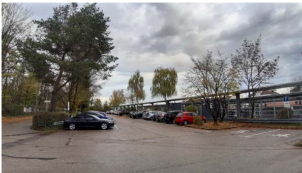
Abbildung 18: Bahnhofsplatz mit Parkplätzen und der Zufahrt zum Jugendkulturzentrum