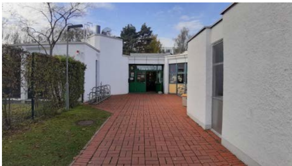
Abbildung 13: Eingang auf der Ostseite des Gebäudes