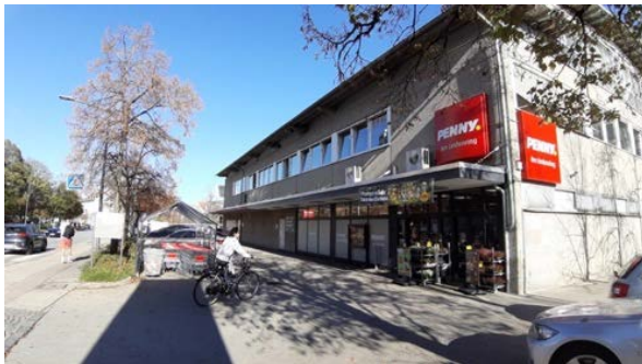
Abbildung 7: Westfassade des Supermarktes am Lindenring 3