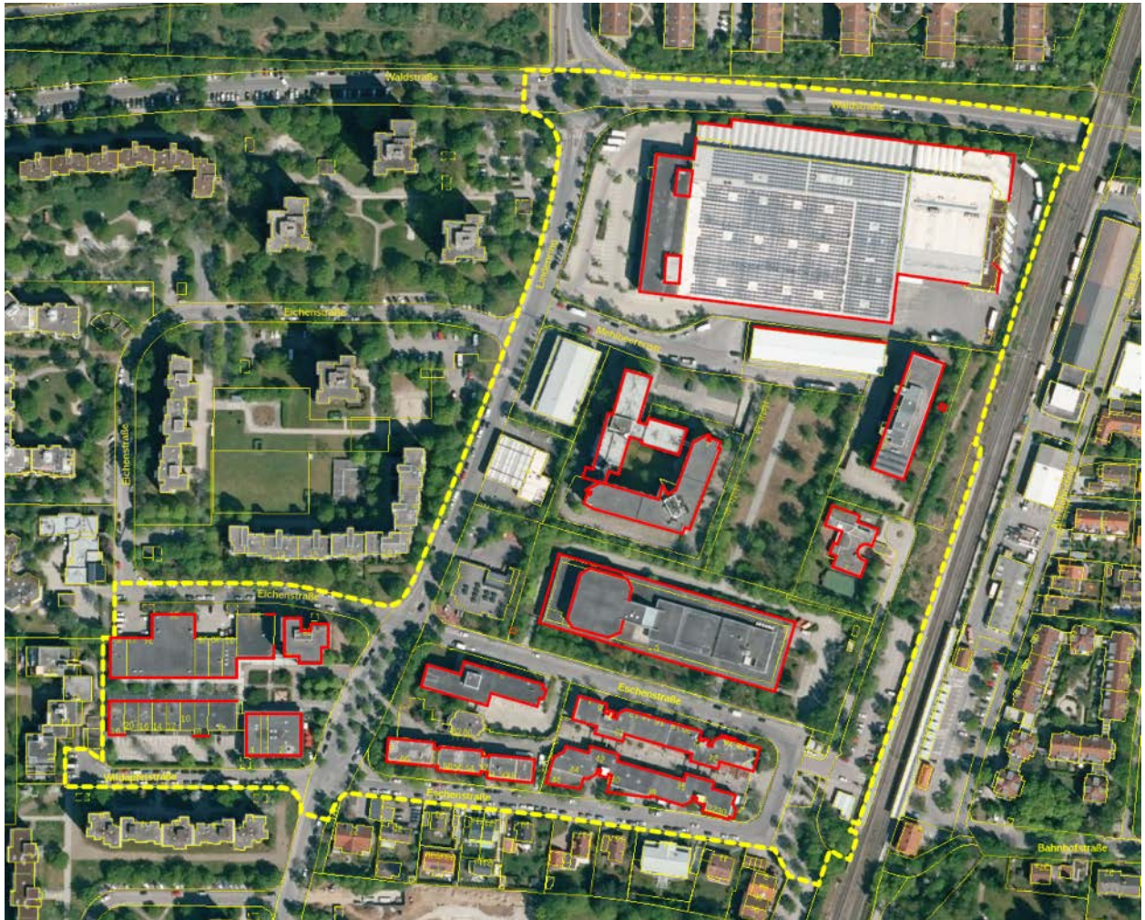
Abbildung 27: Übersicht der potenziellen Quartierstrukturen an Gebäuden (rot markiert) im Untersuchungsgebiet (gelb umrandet)