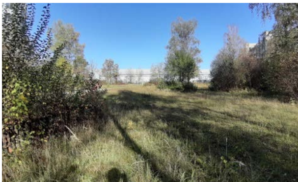
Abbildung 9: parkähnliche Grünfläche zwischen Mehlbeer- und Eschenstraße