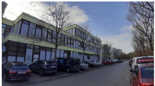
Abbildung 21: Nördliche Fassade der nördlichen Gebäudereihe von der Eschenstraße aus