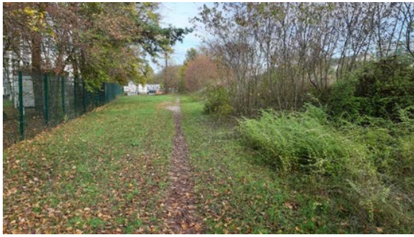
Abbildung 11: Grünstreifen mit eingezäuntem Grundstück der Mehlbeerstraße 6