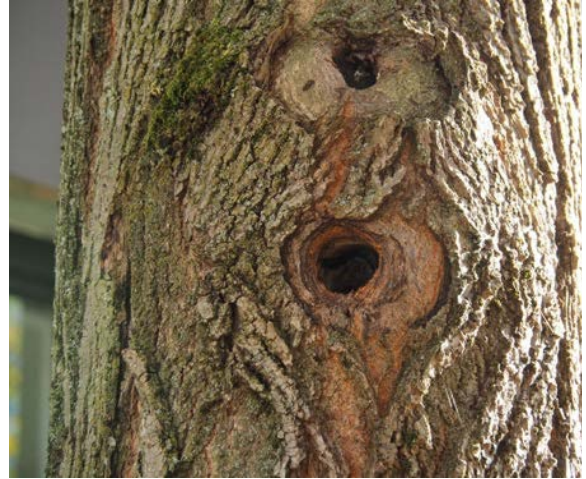
Abbildung 25: Spechthöhle in einem Baum in der Mehlbeerstraße 6