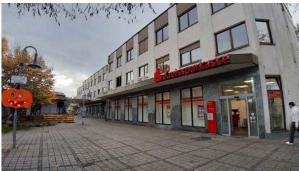
Abbildung 20: Blick vom Lindenring auf Nordfassade der südlichen Gebäudereihe