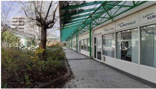
Abbildung 22: Überdachter Mittelgang im Westen der Lindenpassage