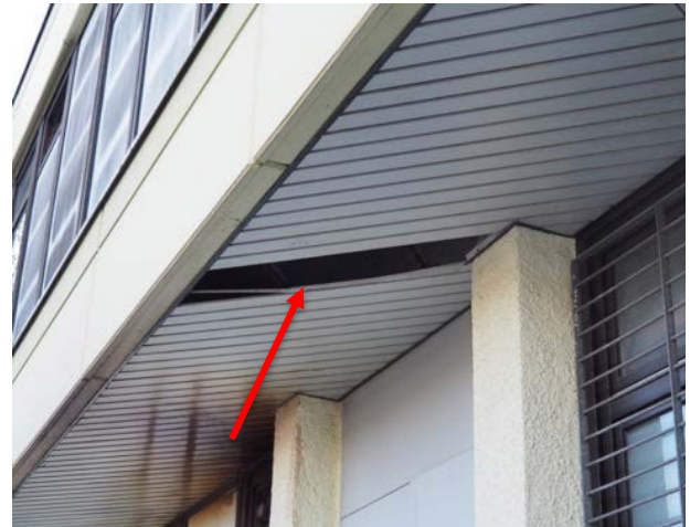
Abbildung 33: Einflugmöglichkeit für Fledermäuse in ein Gebäude in der Eschenpassage (Haus Nr. 26 + 28)